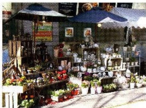
展示即売会（イメージ）