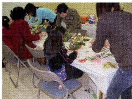
アレンジ教室の様子（イメージ）