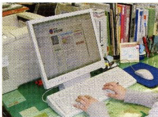
ホームページによる情報発信（イメージ）